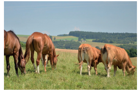
Pâturage mixte équin-bovin

▲ Avant de regrouper les espèces, les faire pâturer séparément sur des parcelles adjacentes