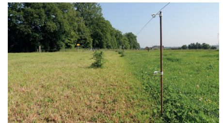
Une parcelle râpée (à gauche...)